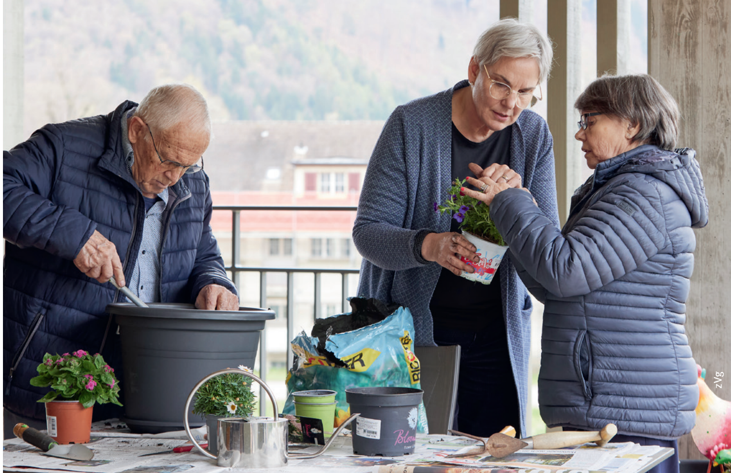
Betreuung und soziale Teilhabe haben in Alters- und Pflegeheimen einen hohen Stellenwert.

müssten Menschen mit Sturzgefährdung, zunehmender Demenz oder sonstiger Unselbständigkeit und Gefährdung nicht ins Alters- und Pflegeheim eintreten, sondern könnten mit der passenden Unterstützung selbständig wohnen bleiben, und dies erst noch zu geringeren Kosten für die Allgemeinheit. Jetzt liegt eine gute Lösung auf dem Tisch, das Parlament ist zur Gutheissung aufgefordert.