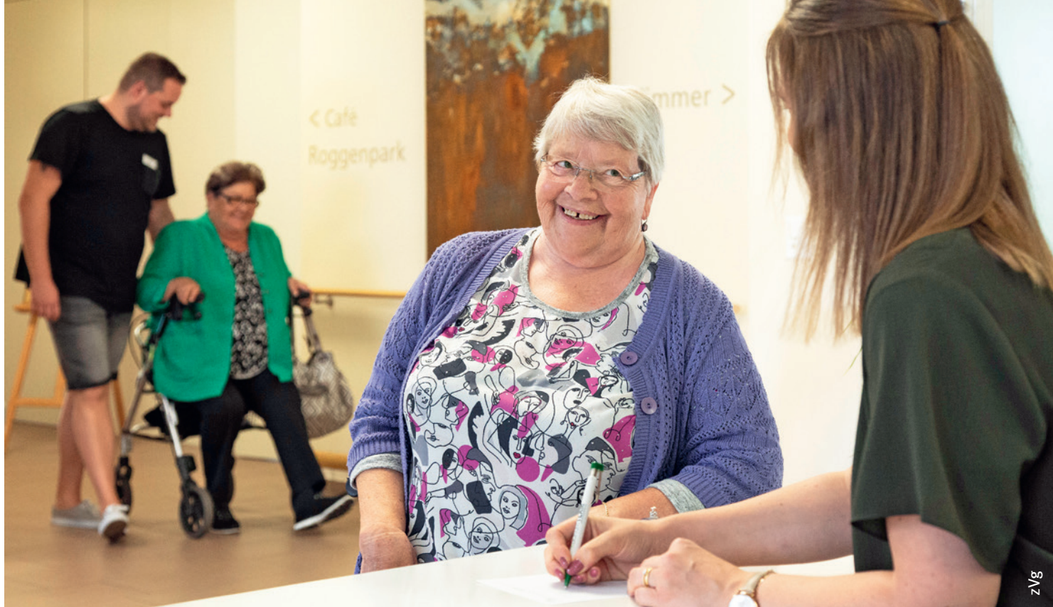
Innovative Ansätze, wie der Einbezug neuer Berufsgruppen, können den Pflegepersonalmangel entschärfen.

wicklung, Anerkennung der Arbeit und finanzielle Entlohnung. Es zeigt sich aber im Alltag, dass die Realität der Arbeitswelt im Widerspruch zu den zentralen Werten der Pflegenden steht. Einerseits ist die Arbeit bei wechselnden Einsatzzeiten und dem 24-Stunden-Betrieb an sieben Tagen die Woche schwierig mit dem Privatleben koordinierbar. Andererseits kann aufgrund der zu knappen Ressourcen nicht so gepflegt und betreut werden, wie es das Berufsethos vorsieht. Wer aus dem Beruf aussteigt, begründet dies hauptsächlich mit besseren Arbeitszeiten und Vereinbarkeit der neuen Tätigkeit mit dem Privatleben oder aber mit der psychischen und körperlichen Belastung in der Pflege.